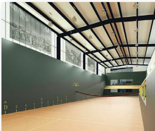
Ein "Jeu de Paume"-Court in Bordeaux im Jahr 2019