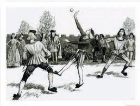
Schläger kamen im 16. Jahrhundert in Gebrauch

Eine weitere Besonderheit beim Jeu de Paume waren die Wände des Klosters, die ins Spiel mit einbezogen wurden. Ähnlich wie beim Squash durfte der Ball gegen diese Wände geschlagen werden. Speziell beim Aufschlag wurde der Ball zuerst gegen eine der schrägen Dächer des Innenhofs geschlagen, um anschließend im Feld des Gegners aufzukommen.